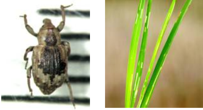
稻水象甲成虫（张润志 摄） 稻水象成虫危害状（张润志 摄）