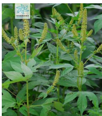
三裂叶豚草