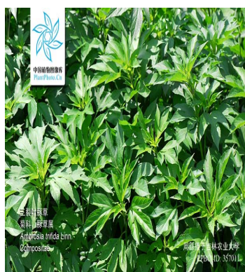
三裂叶豚草